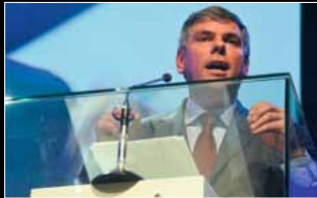
Filip Dewinter: "Naast inburgering moet de klemtoon ook op terugkeer liggen."